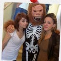
FESTA DI CARNEVALE