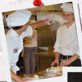
MANI IN PASTA