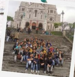
GITA A PARIGI