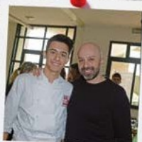
EVENTO CON LO CHEF NIKO ROMITO