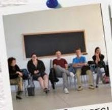
AMICI CANADESI IN VISITA