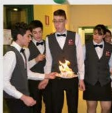
FESTA DELLA DONNA